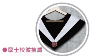
● 學士校徽披肩 經典剪裁 / 精緻電繡